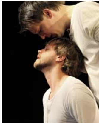
Ken je Klassiekers 2, de Bijbel