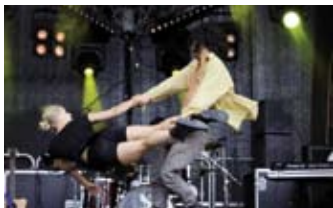
Café Ed Sanders

Rockconcert en dansvoorstelling in één, dat is Café Ed Sanders. De jonge honden van Ed Sanders zijn onbevreesd en kwetsbaar. Alleskunnere die spelen, delen, dansen en vechten, op zoek naar echte beleving. Samen toveren ze een alledaagse omgeving om tot