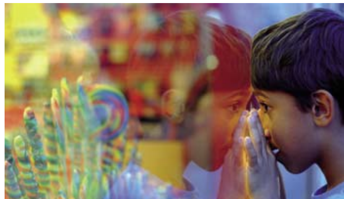
CZ College.

Deze zondag zit vol verleidingen: een fantastisch concert, lekker eten, sociale ontmoetingen of dat nieuwe jurkje dat voor jou ontworpen lijkt. En dat is goed, want kunnen genieten is essentieel voor ons dagelijks functioneren. Hersenonderzoekers onderscheiden drie 'bronnen' van genot die een vergelijkbaar effect hebben op ons brein: