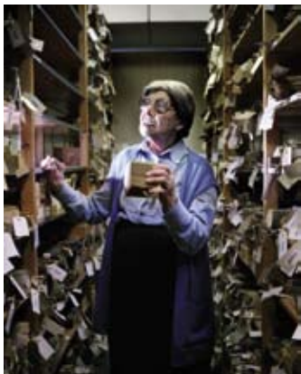
Verpleger van de Geest