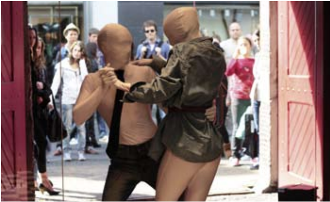
Ik ben niet van plastic