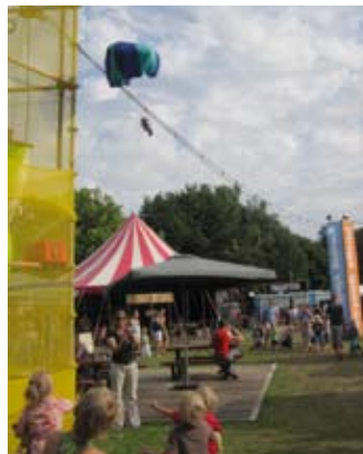
Parachute springen voor knuffels

In speelgoedwinkel Pinokkio kom je komische taferelen tegen. De CliniClowns verzorgen hier een optreden vol verrassingen. 'Een hele lieve knuffel, een beer, zo'n mooie, echte weet je wel? Voor jou uitgezocht en ingepakt. Nou ja ingepakt... heb je even? Inpakken is namelijk een feest op zich!' CliniClowns Nederland staat voor 'de kracht van de lach' en wil een impuls geven aan Physical Comedy als onderdeel van clownerie.