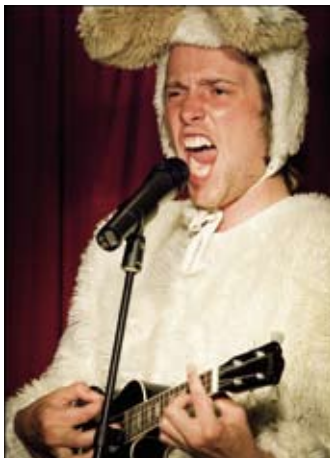
Trio Koenijn