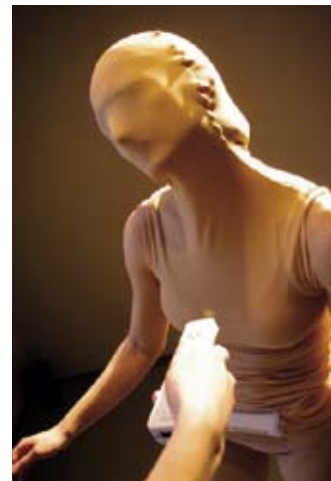
PLAY ME

Iedereen kan Midgetsjoelen. Je weet toch: sjoelen op speciale bakken die geïnspireerd zijn op midgetgolfbanen. Sjoelen 2.0 – the next generation! Midgetsjoelen stoft de sjoelbakken grondig af en zorgt voor een ware ervaring van het oud-hollandse spel. Of je nou een oude sjoelkampioen bent of een rookie : met Midgetsjoelen maak je altijd kans om te scoren.