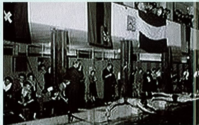
> Zwembad Heiligeweg binnen

In maart 1946 wordt een zoontje geboren. Zes weken later vindt Henk hem dood in zijn wiegje. Een jaar later krijgen ze een dochtertje, maar dan treft hen beiden een tweede groot verdriet. Zij wordt maar drie maanden oud. 'Het was een verschrikkelijke periode waarin ik bij een psychiater heb gelopen. Ook Suze ging mee,' vertelt Henk. Hij ging met dit verlies veel rationeler om dan Suze. 'Henk is niet zo'n prater, nee.' Ondanks hun