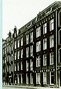
> Atjehstraat 1945