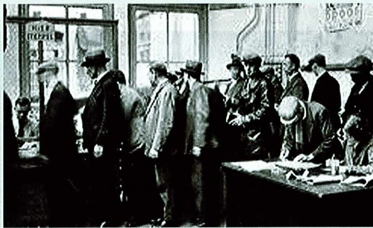
> Werklozen in de rij